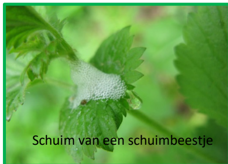
Schuim van een schuimbeestje

leuw jakkes bakkes vies! Er kwamen allemaal druppels af.